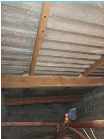
Matériaux : ZPSO-001