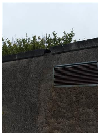
Matériaux : ZPSO-002